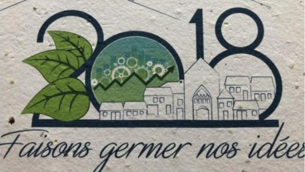
Une carte de vœux imprégnée de graines de fleurs sauvages.